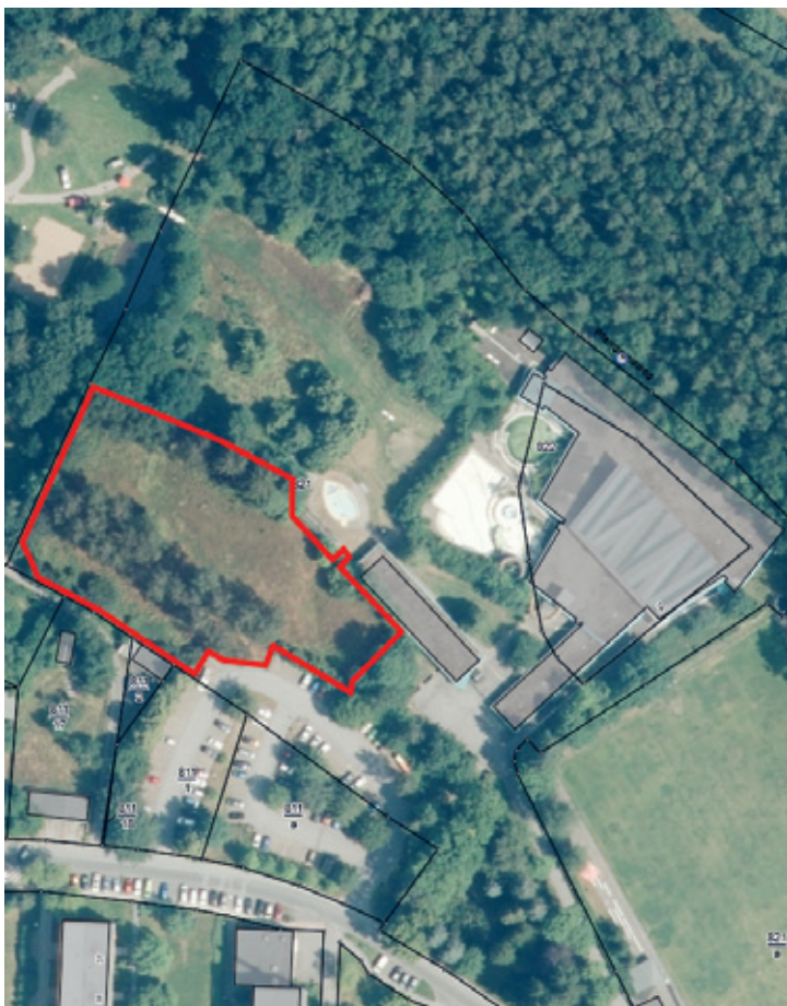
Flst. 821 - Stadtbadstraße 14, 09380 Thalheim/Erzgeb.

Thalheim/Erzgeb., eine malerische Stadt im Herzen des Erzgebirges, liegt eingebettet in die sanfte Hügel- und Kuppenlandschaft des sächsischen Mittelgebirges.